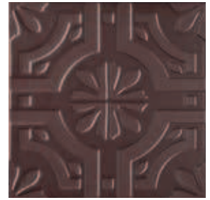
Triplex Real Brown