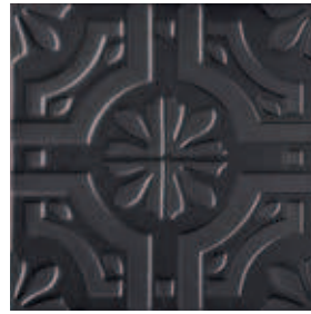
Triplex Real Black