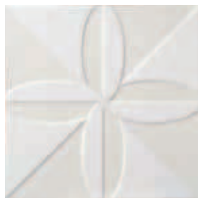
Triplex Fronteira White