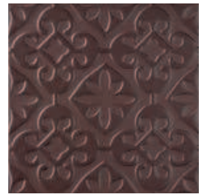
Triplex Valverde Brown