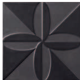
Triplex Fronteira Black