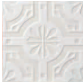
Triplex Real White