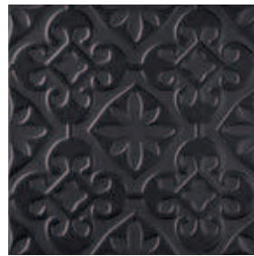
Triplex Valverde Black