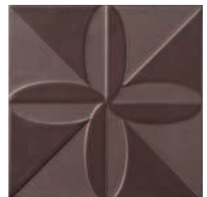
Triplex Fronteira Brown