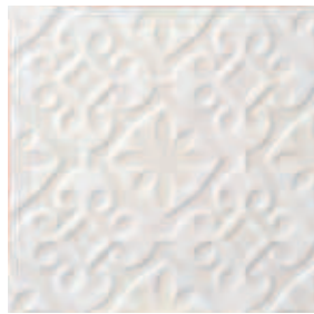
Triplex Valverde White